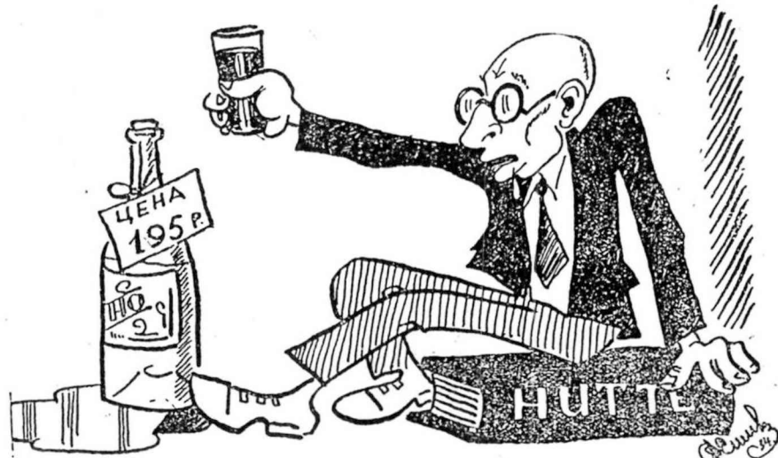
ЗЕЗИН: Опять на этом самом месте память изменила, где и как я эти деньги... про...зевал